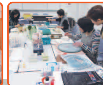
高齢者総合福祉センター ニッセイ松戸アカデミー