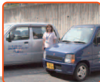
ニッセイせいいい 在宅介護サービスセンター ベル西大和店