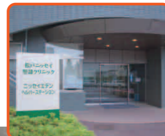
在宅介護サービスセンター ニッセイエデン ヘルパーステーション