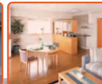
介護付有料老人ホーム 松戸ニッセイエデンの園